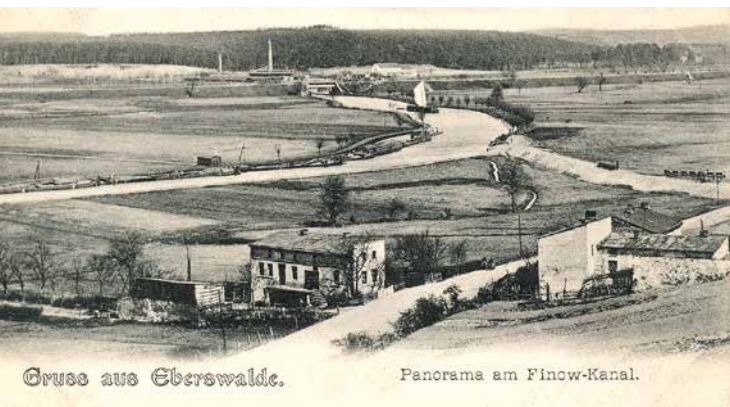
Grube aus Eberswalde.